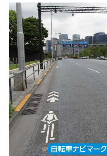
自転車ナビマーク