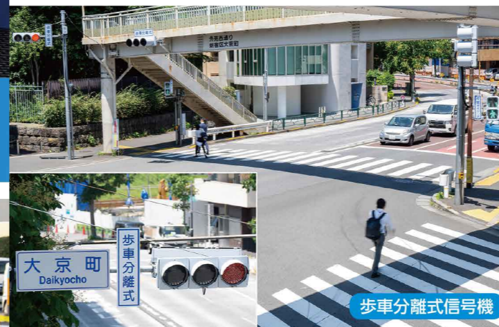
歩車分離式信号機