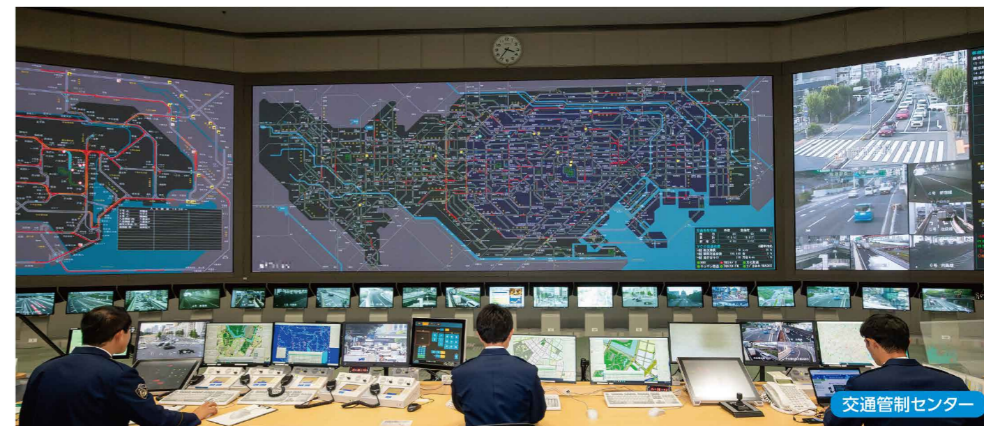
交通管制センター

また、自転車や特定小型原動機付自転車の利用者の方に、乗車用ヘルメットの着用を促すほか、車道通行の原則などの交通ルールを周知するとともに、信号無視や一時不停止などの危険な運転行為に対する指導取締りを強化しています。