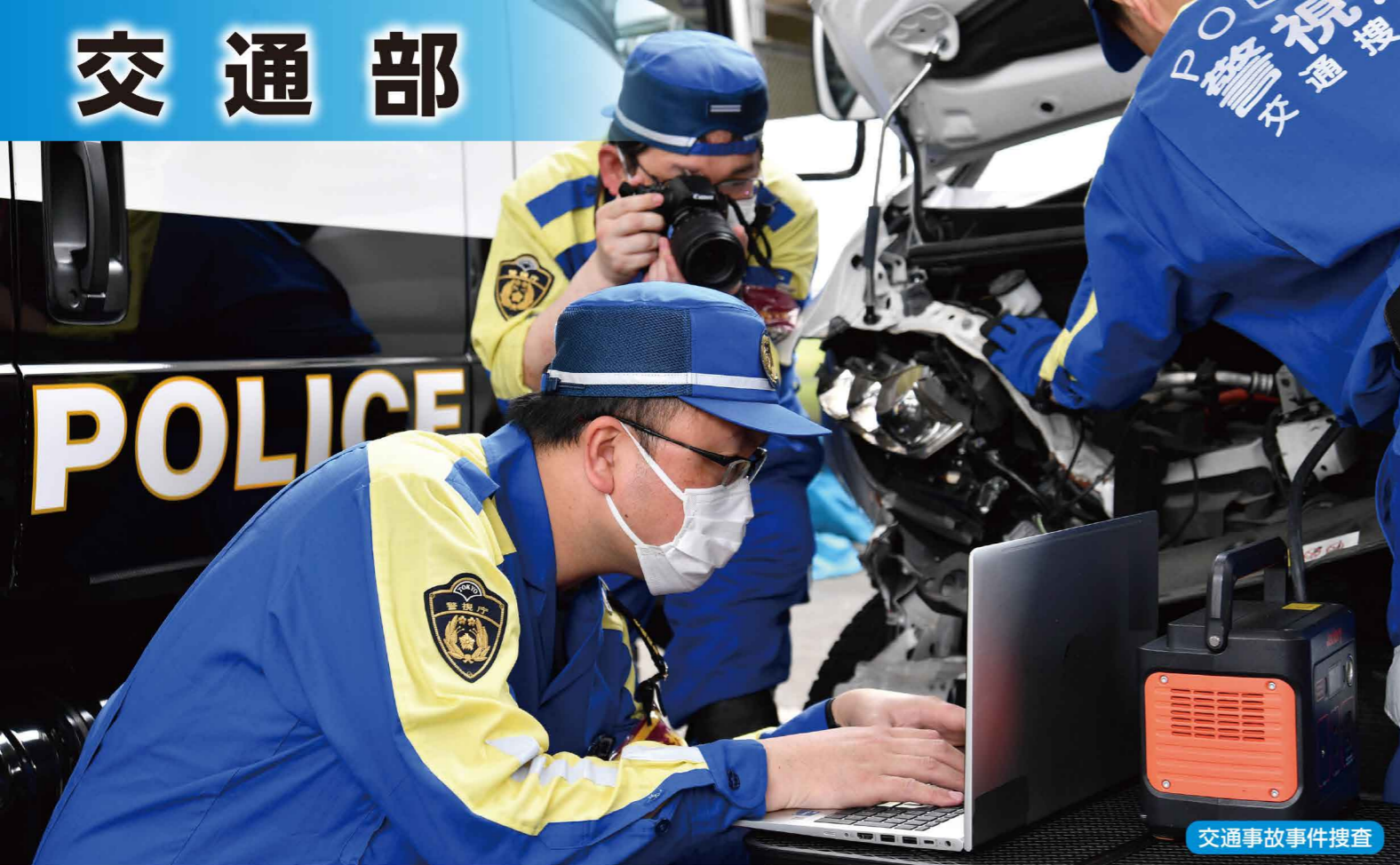
交通事故事件捜査