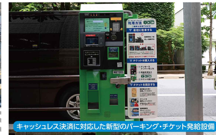
キャッシュレス決済に対応した新型のパーキング・チケット発給設備