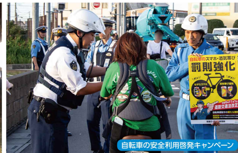
自転車の安全利用啓発キャンペーン