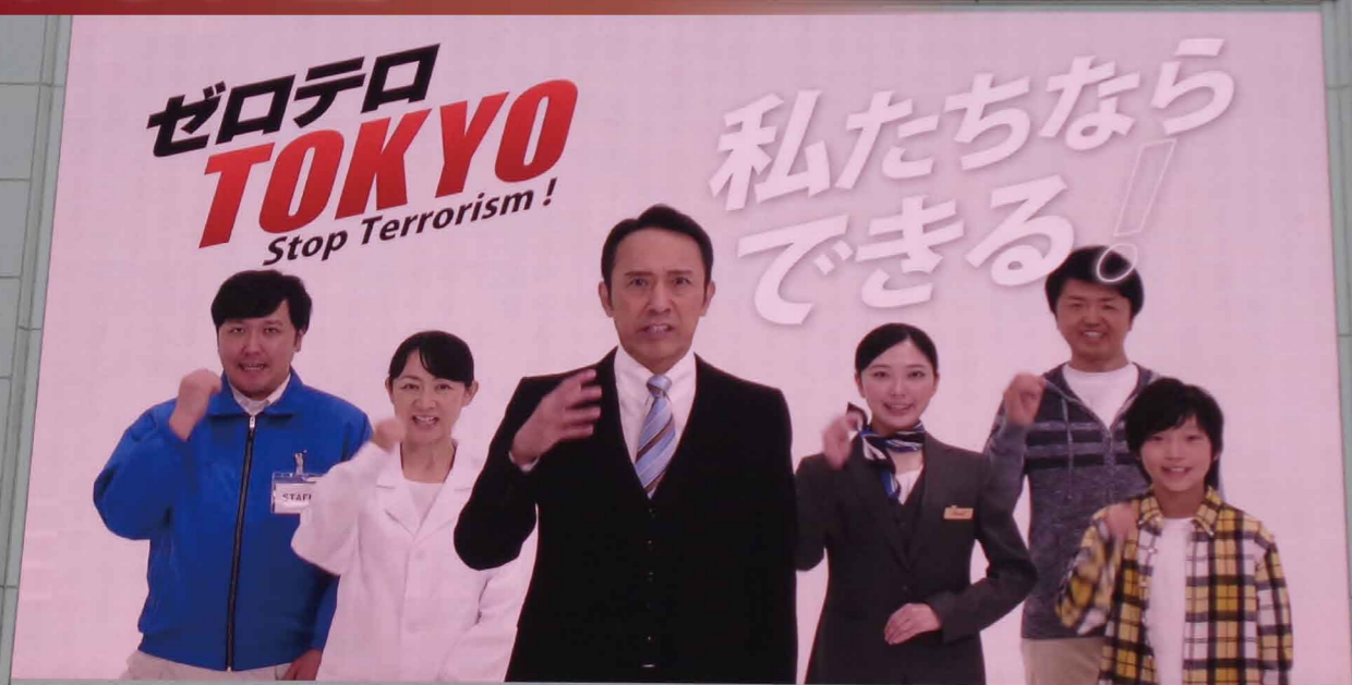
街頭ビジョンを用いた広報啓発活動