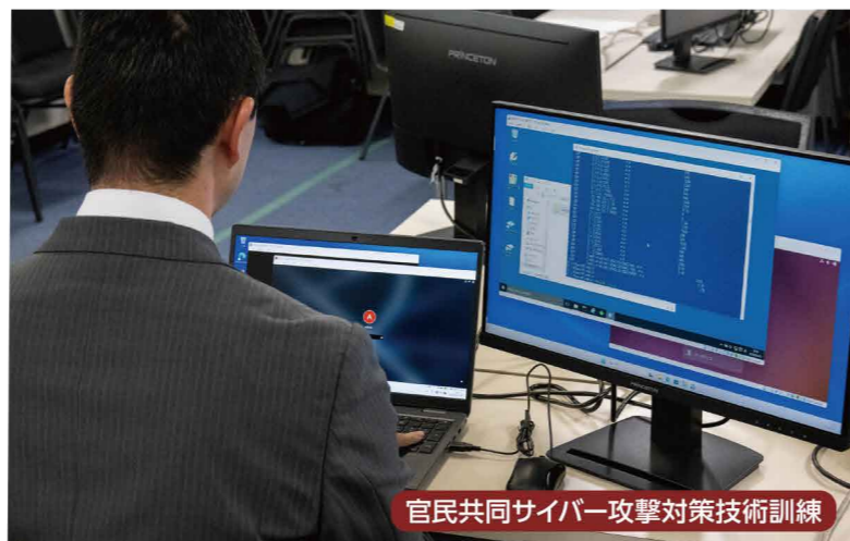
官民共同サイバー攻撃対策技術訓練

警視庁では、都民・国民の安全・安心を確保するため、経済安全保障やサイバー攻撃に対する取組、国際テロ組織、過激派、右翼等によるテロ等不法事案の未然防止に向けた諸対策、対日有害活動の取締り、北朝鮮による拉致容疑事案の捜査等を推進しています。