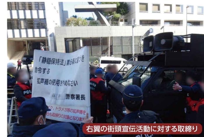
右翼の街頭宣伝活動に対する取締り