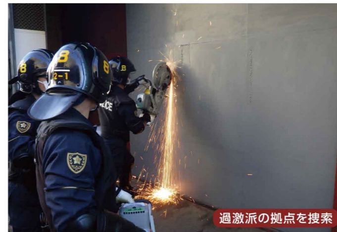
過激派の拠点を搜索