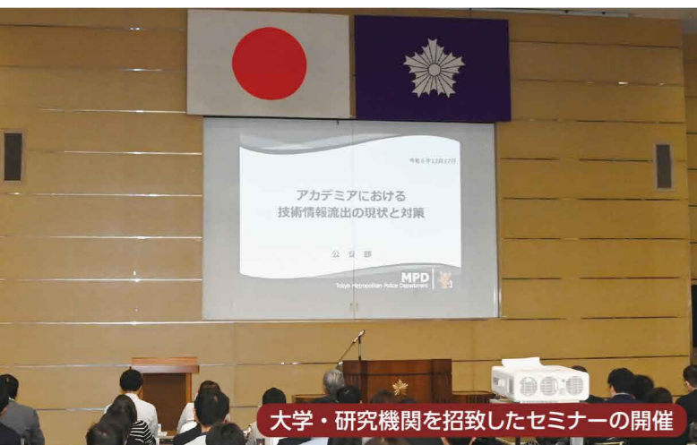
大学・研究機関を招致したセミナーの開催