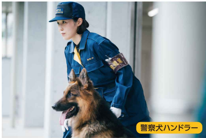
警察犬ハンドラー

女性職員の採用活動の強化、男性職員の家庭参画の推進、施設・装備資器材の整備などにより、女性職員が働きやすい職場環境づくりを推進し、能力や実績に応じた性別を問わない人材登用を実現しています。