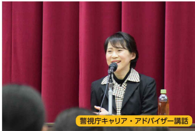
警視庁キャリア・アドバイザー講話