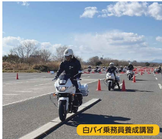
白バイ乗務員養成講習