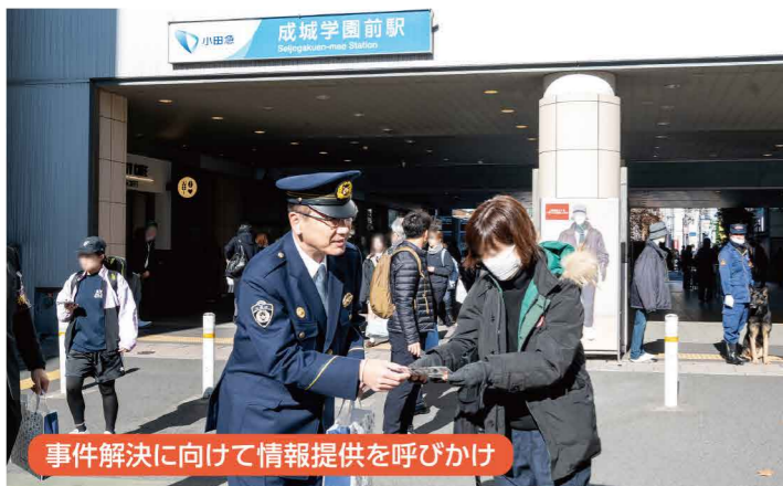
事件解決に向けて情報提供を呼びかけ

都内では、「強盗」、「性犯罪」、「特殊詐欺」、「侵入窃盗」など、私たちの日常を脅かす多くの事件が発生しています。警視庁では、これらの犯罪実態を的確に把握・分析するとともに、事件発生時には速やかに臨場し、最新の捜査手法を駆使するなど、事件の早期解決に向け、迅速かつ的確な捜査を強力に推進しています。