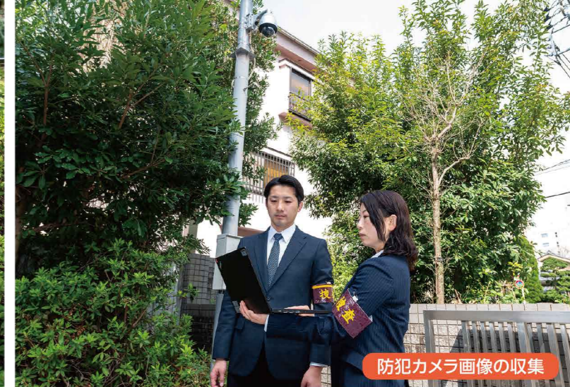
防犯カメラ画像の収集