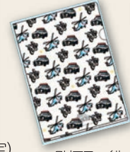
クリアファイル A4サイズ