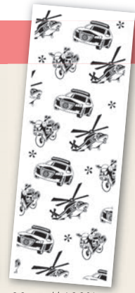
てぬぐい 約34cm×90cm 綿100%