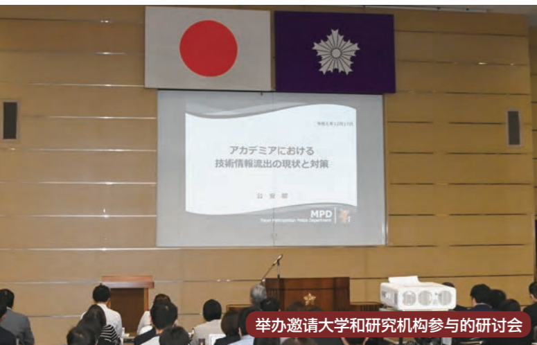
举办邀请大学和科研机构参与的研讨会