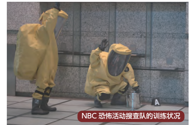
NBC 恐怖活动搜查队的训练状况

※NBC 恐怖活动是指使用 N (Nuclear : 核) B (Biological : 生物) C (Chemical : 化学) 物质的恐怖行为的总称。