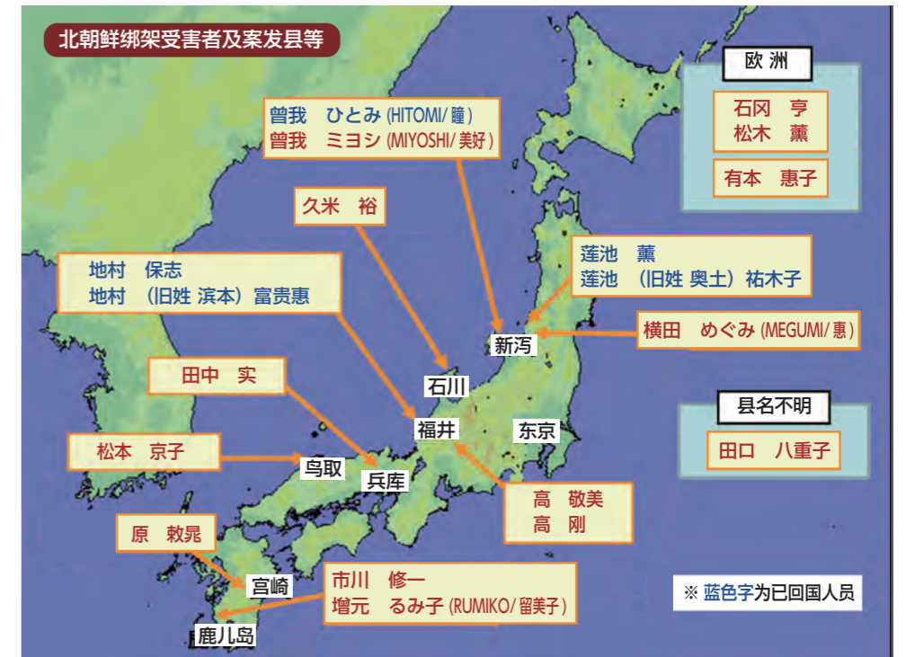
北朝鲜绑架受害者及案发县等