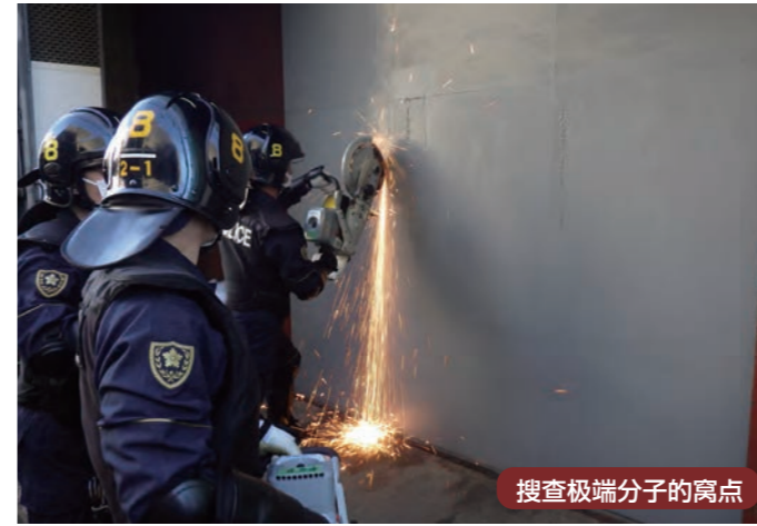
搜查极端分子的窝点