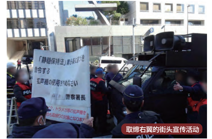
取缔右翼的街头宣传活动