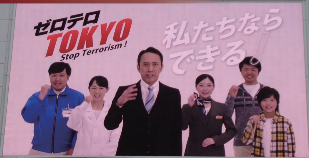
街头视觉广告启迪活动