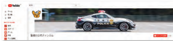
You Tube 警视厅官方频道

警视厅在视频共享网站 YouTube 上开设了官方频道，通过官方频道发布宣传视频等视频。除了利用该频道宣传警视厅的各种活动以外，警视厅还通过发布通俗易懂的必要信息视频，强化信息传播工作。此外，在警视厅官网上，警视厅的各部门也会在视频库中发布视频。