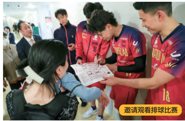
邀请观看排球比赛

此外，警视厅还通过举办面向中学生和高中生的“生命重要性学习讲座”，由遗属进行演讲，以及与企业等合作，邀请因案件和事故失去家人的孩子们观看体育比赛或音乐会等活动，以推动全社会共同支持受害者。