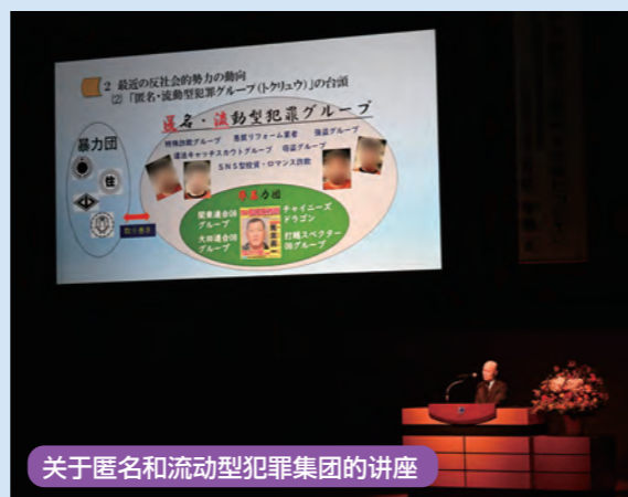
关于匿名和流动型犯罪集团的讲座