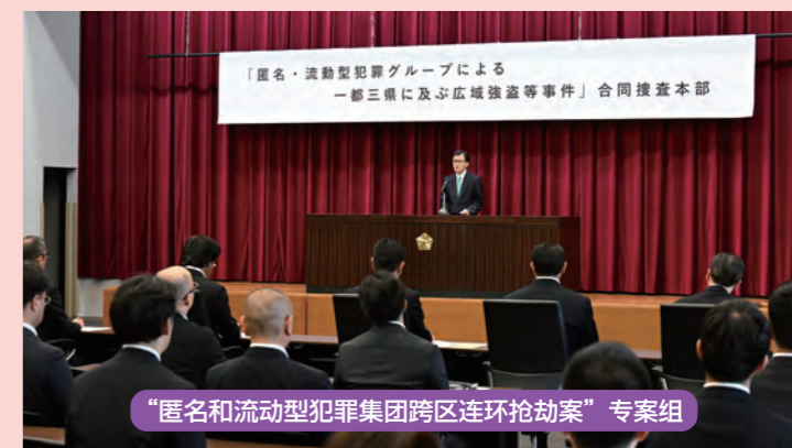
“匿名和流动型犯罪集团跨区连环抢劫案”专案组

警视厅将匿名和流动型犯罪集团对策作为最重要的治安课题，持续强化查处，针对涉案范围广的连环抢劫案设立了专案组，截至 2025 年 6 月 11 日，已侦破 18 起案件，逮捕 51 人。