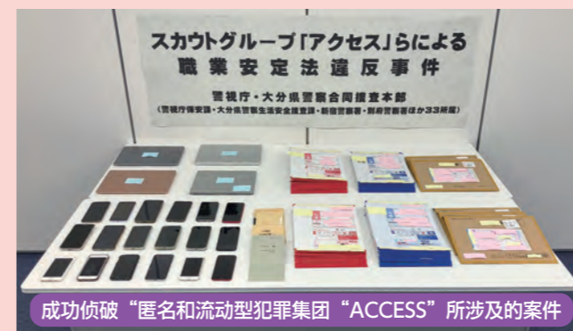
成功侦破“匿名和流动型犯罪集团“ACCESS”所涉及的案件

此外，成功侦破了匿名和流动型犯罪集团案件所实施的其他案件，例如“风俗招募集团所实施的案件”、“恶劣装修集团所实施的案件”等。