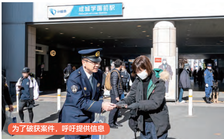
为了破获案件，呼吁提供信息

在东京都，每天都有很多给我们日常生活带来危害的犯罪发生，诸如“抢劫”、“性犯罪”、“特殊诈骗”、“入室盗窃”、“抢夺”等。警视厅在切实掌握和分析这些犯罪案件实际状况的同时，也采取在案件发生时迅速抵达现场、运用最新侦查手段等措施，强力推动开展迅速且有效的侦查，以期早日破获案件。