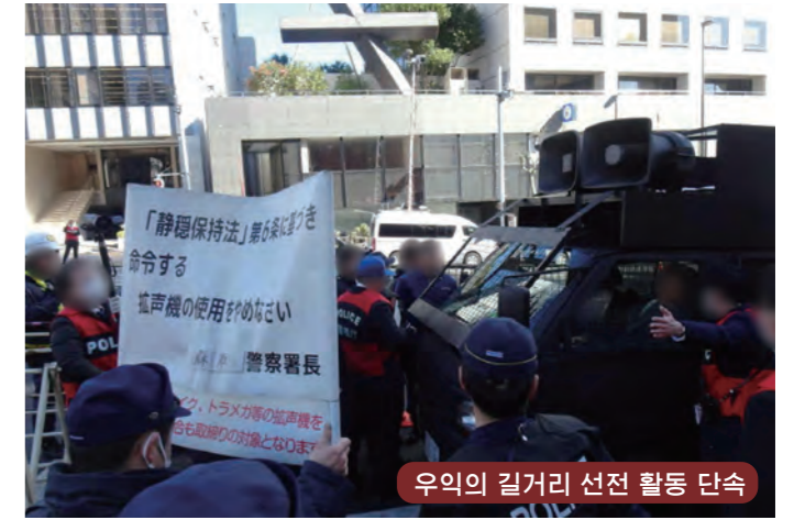
우익의 길거리 선전 활동 단속