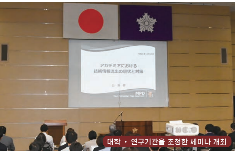
대학 · 연구기관을 초청한 세미나 개최