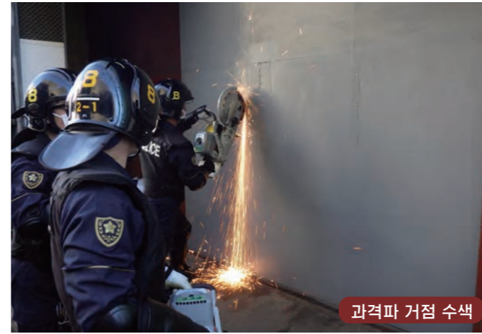
과격파 거점 수색