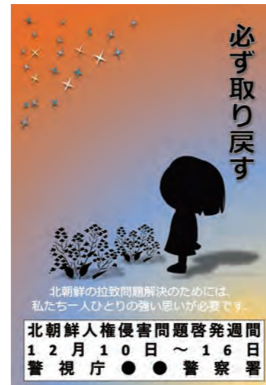
홍보 계몽 포스터