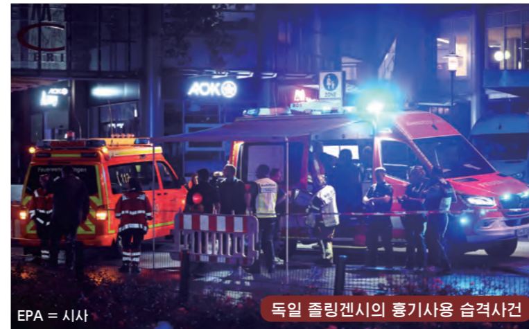
EPA = 시사