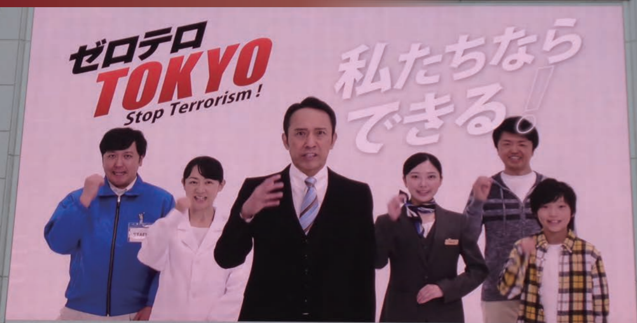
옥외 광고판을 이용한 광고 계몽 활동