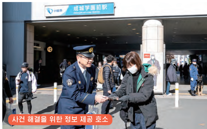
사건 해결을 위한 정보 제공 호소