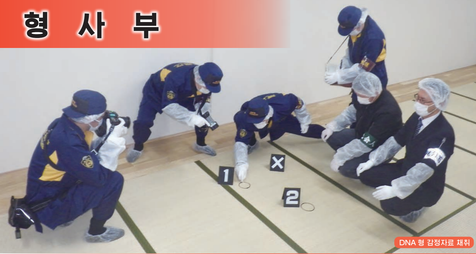
DNA 형 감정자료 채취