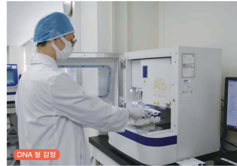
DNA 형 감정