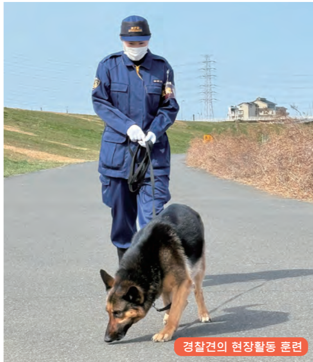
경찰견의 현장활동 훈련