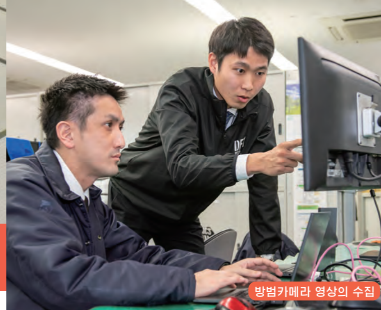
방범카메라 영상의 수집