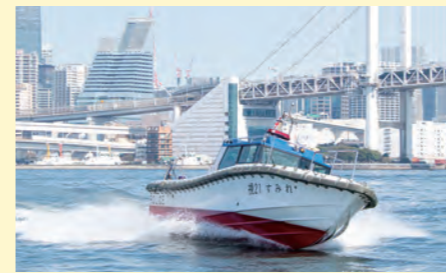
경비정에 의한 수상 추적