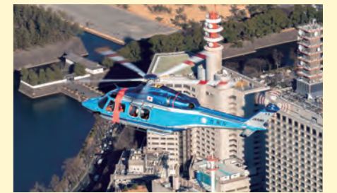
헬리콥터에 의한 상공 추적