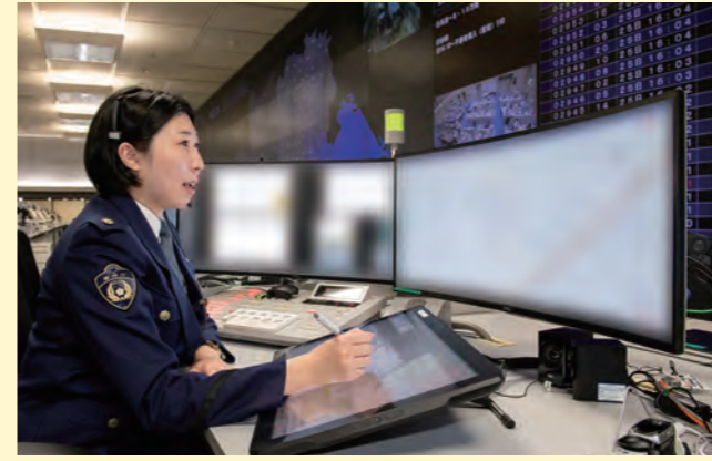
110 번 신고 접수