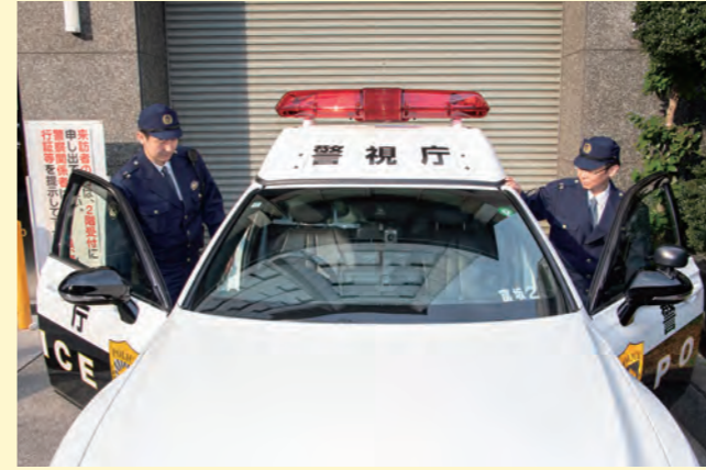
지령을 받고 바로 현장으로 출동