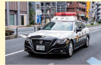
순찰차에 의한 추적