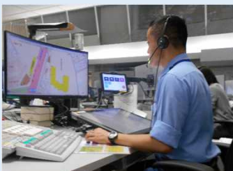
システム活用状況