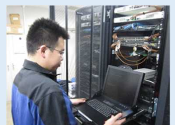
通信機器情報解析