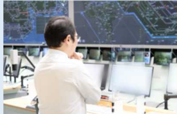
信号機の設定秒数を検討