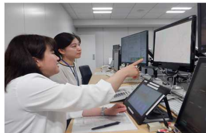
交通テレビカメラの操作を行っている様子

大学で学んだ専門分野を生かして社会に貢献できる仕事がしたいという思いから、学んだ知識を生かせる就職先について調べていたところ、警視庁に電気職の採用があることを知りました。父が警視庁警察官であったこともあり、立場は違うものの学んできた知識を「首都・東京」を守る警視庁で生かしたいとの思いで志望しました。