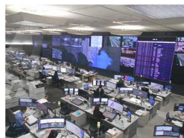
本部指令センター （警視庁本部）

通信指令システムの維持管理、新たな機能の導入、将来を見据えた研究等に取り組んでいます。通信指令システムは、現場の警察官が常に迅速、的確に活動できるよう、24時間365日安定稼働することが求められるとともに、社会全体でIT化が進む今日、日々アップデートしていく必要もあり、責任の大きい仕事です。