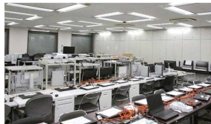
端末機室（システム検証ルーム）

大学3年生の時に就職活動の準備をする中で、人々の安全・安心を守る警察の仕事に興味があったため、警視庁の説明会に参加しました。警視庁には警察官だけでなく、警察行政職員という職種があり、その中に大学で勉強した情報処理の分野を生かせる「電気職」があることを知り、志望しました。