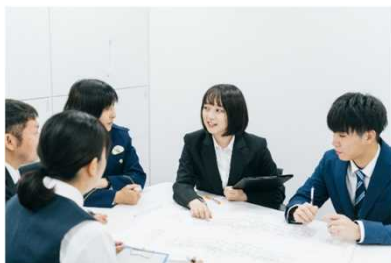
設計や工程などの打合せ