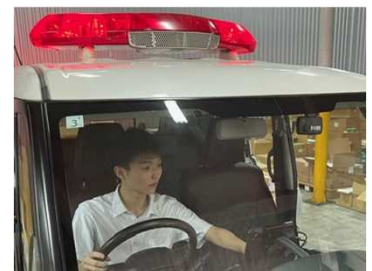
パトカー用機器設置後の動作確認