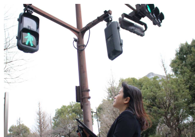
信号機実査の様子

当課では交通信号機を始めとした交通安全施設の維持管理や運用業務を行っています。これまで信号機の工事設計や設計書類の審査に係る業務等を行ってきました。現在は、交通の安全と円滑を考慮した信号機の運用見直しや、東京マラソンなどの交通規制を伴う大規模イベント時の信号調整に係る業務を担当しています。