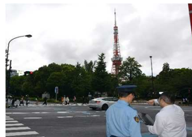
現場における信号設定秒数の検討

これまで、信号機や車両感知器などの整備や運用に係る仕事に携わってきました。現在は、これらの施設をコントロールする交通管制センター中央装置の高度化や維持管理に係る業務を担当しています。A I 等の新たな技術の導入にも取り組んでおり、これまで以上に安全で快適な交通環境を実現できるよう日々取り組んでいます。