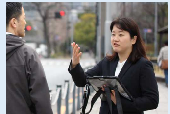
交差点における交通量の確認