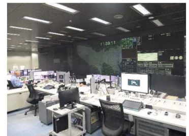
多摩指令センター (多摩総合庁舎)

110番受理、無線指令等の初動警察活動に欠かすことのできない「通信指令システム」の維持管理等に従事しています。具体的には、本部・多摩指令センター内機器の日常点検、警察署等に設置の端末の更新、システムで使用する地図等各種情報の更新、パトカー等に設置の通信指令システム用各種機器の更新・調整です。