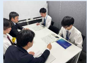
契約業者との打合せ