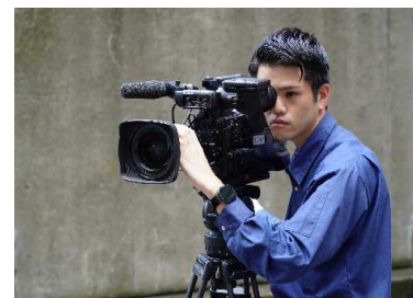
行事・警備の撮影