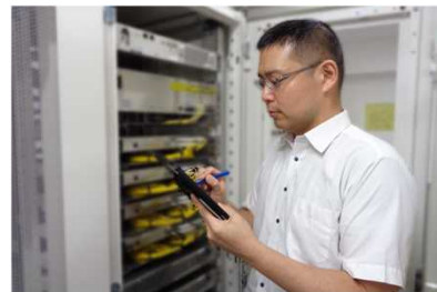
通信施設の維持管理

東京2020オリンピック・パラリンピック競技大会の際は、警察テレビを活用して会場周辺の映像を警視庁の警備本部等に伝送する業務に従事し、歴史的に残る警備の一翼を担ったことに誇りを感じるとともに自信につながっています。現在は、テレビ等でも見ていた無線機を実際に触りながら、その技術を学べる日々で非常に充実しています。そのような中で、自分の仕事に成果が出たとき、警察官に「ありがとう」とお礼を言われると達成感とともに大きなやりがいを感じ、転職をして良かったと思っています。