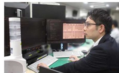
新システムの開発

主に警視庁で使用しているサーバーの運用管理等を行っています。警視庁の各システムは警察業務の性質上、24時間365日安定して稼働させることが求められ、システムの安定した稼働のために、8交代制で日々の監視や警察署等からの業務システムに関する問合せ対応を行っています。