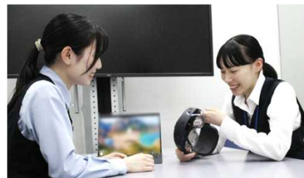
新技術についての調査

私が所属しているシステム第一係では、それらのシステムの開発や運用保守、プログラムの作成、ソフトウェアの動作検証等を行い、警視庁全体の警察活動が円滑に進むよう支援しています。