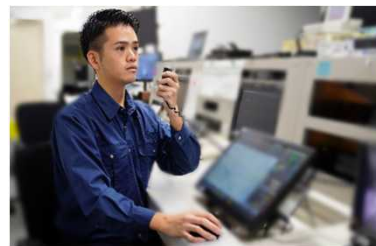
ヘリコプターカメラ受信操作

各国の要人が日本に来日する際やオリンピックなど大規模な警備を実施する際に重要とされる場所へカメラを設置し様々な通信機器を用いて警視庁本部等に映像伝送することで、警備の指揮を執るための支援を行うなど、警視庁の警備活動に直接的に関わることができる仕事です。また災害派遣では広域緊急援助隊として現地に向かう途中や現地の先々で様々な方から激励の言葉をかけてもらうなど、多くの人の期待を肌で感じることができ、とてもやりがいのある仕事です。