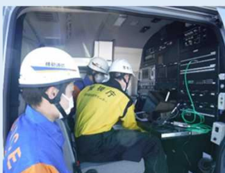
衛星通信車の操作