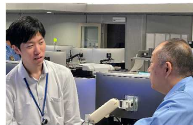
係員からの意見聞き取り