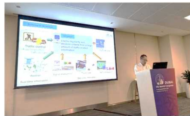
I T S 世界会議での論文発表

大学で学んだ電気工学を公務員として生かせる職場を探していました。電気工学を生かせる採用募集が少ないことから警察官も受験することを検討していたところ、警視庁に電気職があることを知り、友人の警視庁に勤める父から警視庁での仕事のやりがいについて色々教えて貰ったことがきっかけです。