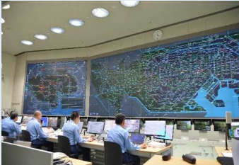
交通管制センター